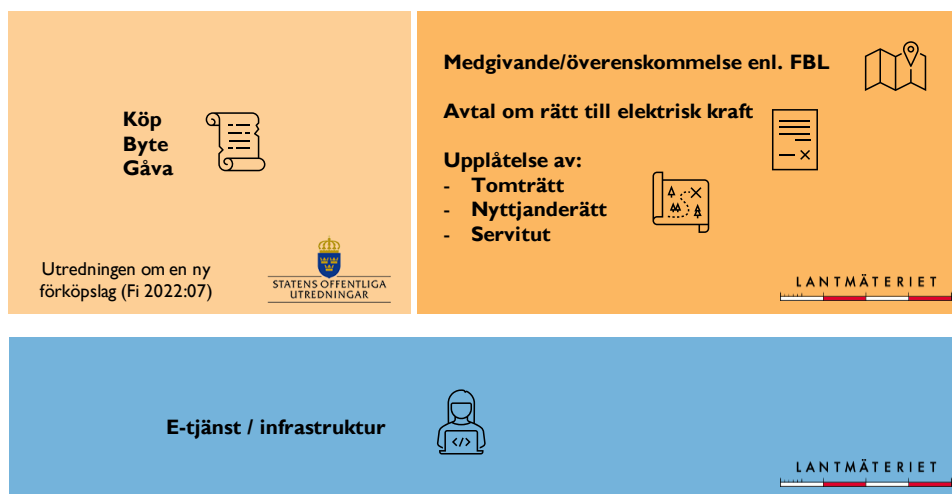
Figur 1: Avgränsningen mellan Lantmäteriets regeringsuppdrag och Utredningen om en ny förköpslag (Fi 2022:07).

Genom tilläggsdirektiv (dir. 2023:67) fick Utredningen om en ny förköpslag ett utökat uppdrag att bland annat föreslå författningsändringar som möjliggör elektronisk ansökan i alla inskrivningsärenden samt inskrivning med stöd av elektroniska originalhandlingar. Utmaningar med elektronisk ansökan berörs övergripande i avsnitt 5.3.5 men kommer därutöver inte att behandlas ytterligare inom detta uppdrag. Det är dock viktigt att det framtida regelverket inte innebär inlåsnings effekter som i onödan kräver att sökanden använder pappersbundna avtal och ansökningsförfaranden.